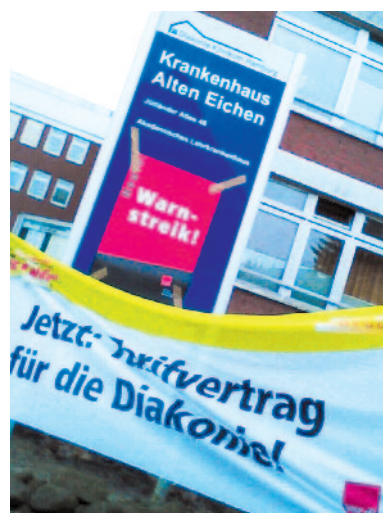
VER.DI HAMBURG (2)

Wir würden gern mit den diakonischen Arbeitgebern verhandeln, sprechen, nicht streiken. Doch dazu müssen sie anscheinend über das letzte Mittel, den Streik gezwungen werden.