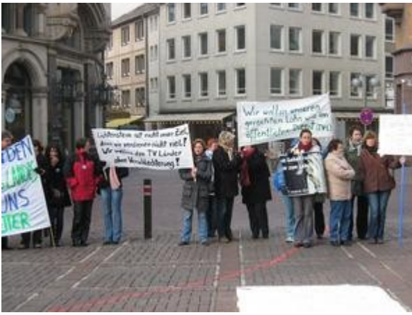
Weitere Forderungen wurden auf einer Bodenzeitung gesammelt